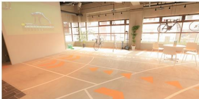
フィールドスペース