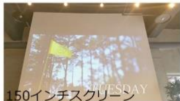
150インチスクリーン