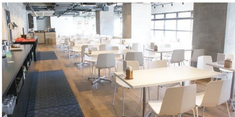
ダイニングスペース