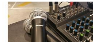
※マイク、Blu-ray・DVDプレーヤー