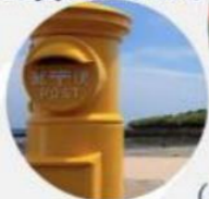
⑥ 幸せの黄色いポスト