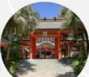
⑤ 青島 (青島神社、青島ビーチ)