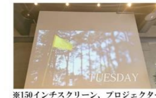
※150インチスクリーン、プロジェクター